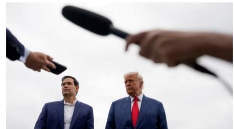
President Donald Trump stands next to Secretary of State Marco Rubio at Morristown Municipal Airport in Morristown, New Jersey, on June 8.

Published 2:02 PM EDT, Fri June 27, 2025