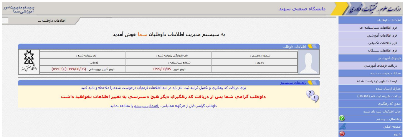
شکل ۲. تکمیل موارد مربوط به اطلاعات داوطلبان شامل اطلاعات شناسنامه‌ای، آموزشی و ...

۲- تکمیل قسمت اطلاعات داوطلبان شامل فرم اطلاعات شناسنامه‌ای، فرم اطلاعات آموزشی، فرم اطلاعات تکمیلی، فرم اطلاعات بستگان (شکل ۲).